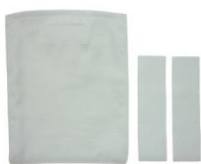
ポケット×1個 ループ×2本