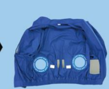
これで完成です。空調ファンを取り付け可能です。