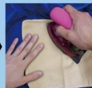
当て布をして裏表ともアイロンし貼りついたら完成です。