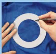
付属の型紙を当てて穴を開ける部分にしるしを付けます。