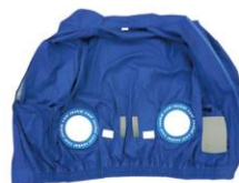
ワッペンにより穴部分が補強され、ファンを固定できるようになります。