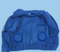
穴を開ける位置を決めます。ウェアの下部からだいたい15~20cmあたりです。

[ワッペン取付手順] ※下記画像は無地ワッペンを使用しております。実際の商品は無地ではありませんので、ご了承ください。