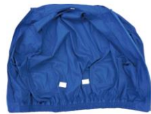
お手持ちのウェアに取付け可能。