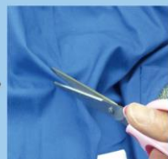
しるしに沿ってハサミ等で穴を開けます。