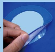
ワッペンを挟みます。