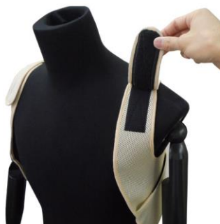
フリーサイズ。マジックテープで調整可能です。