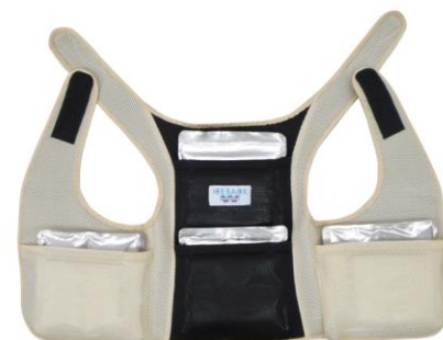
背中上下の2箇所、両脇の2箇所、計4箇所に保冷剤を入れて使用します。

背中と脇を保冷剤4つで効率的に冷却 生地は速乾性とクッション性を備え快適な着け心地