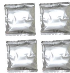
アルミ保冷剤×4個付き