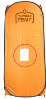
A4サイズの紙が入れる透明ポケット付き。