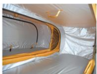
連結させたテントの内部。