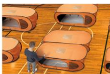
家族単位で連結させても便利。