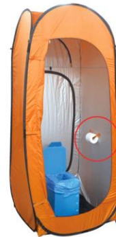
トイレトペーパーホルダー付き。