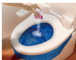
抗菌非常用トイレ1回分 抗菌性凝固消臭剤×1個、排泄袋×1袋