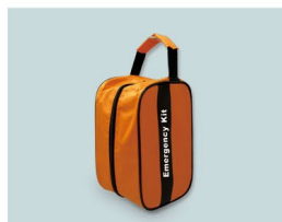
壁などに掛けても便利に使えます。