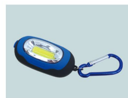
LEDライト 点灯モードと点滅モードの切替可能。マグネットで固定も可能。