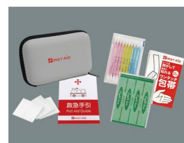
救急セット 収納ポーチ・絆創膏・包帯・コットンパフ・綿棒・救急手引