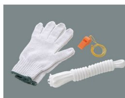
軍手、ホイッスル、ロープ3m 非常時に役立つ3点セット