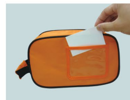
名刺サイズの紙を入れられるポケット付きです。