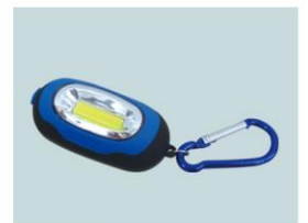
LEDライト 点灯モードと点滅モードの切替可能。マグネットで固定も可能。