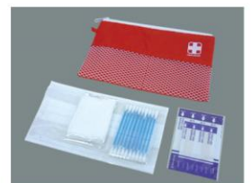
救急6点セット 救急ポーチ、マスク、綿棒、絆創膏大、絆創膏小