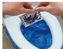
抗菌非常用トイレ1回分 抗菌性凝固消臭剤×1個、汚物袋×1袋