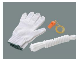
軍手、ホイッスル、ロープ3m 非常時に役立つ3点セット