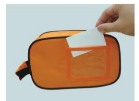
名刺サイズの紙を入れられるポケット付きです。