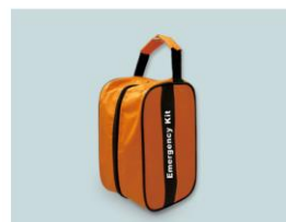
壁などに掛けても便利に使えます。