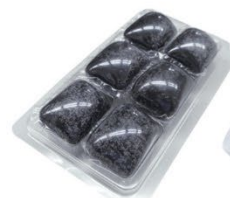
▲BR-957-bk 凝固剤(黒)6個入パック