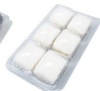
▲BR-957-wh 凝固剤(白)6個入パック