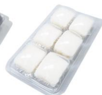
▲BR-957-wh 凝固剤(白)6個入パック