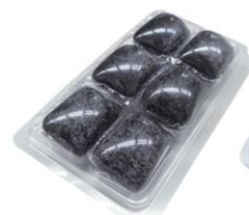
▲BR-957-bk 凝固剤(黒)6個入パック