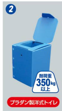
洋式トイレで「安心」