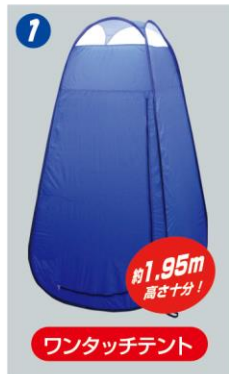
ワンタッチ式で「簡単」

どこでも簡単に設置ができて便利。災害時確保するのが困難となるプライバシーもこの災害用トイレ3点セットで安心。ゆったり排便可能です。また、セット品はいずれも軽量なので持運びラクラク。居心地のいい場所に簡単に移動させて排便できます。