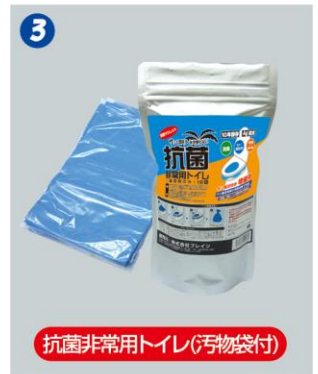
抗菌性凝固消臭剤で「快適」