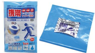
▲凝固剤×1個、汚物袋×1袋のセット