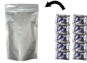
▲アルミ凝固剤×10個入りアルミパック