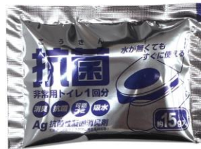
▲1回分ごとにアルミパック