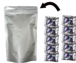
▲アルミ凝固剤×10個入りアルミパック