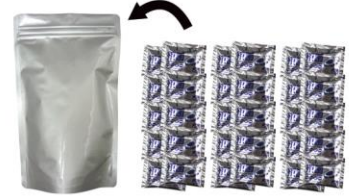
▲アルミ凝固剤×30個入りアルミパック