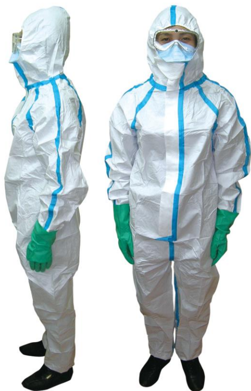
※装着イメージ(靴カバーは装着していない状態ですが、靴カバー付きです)