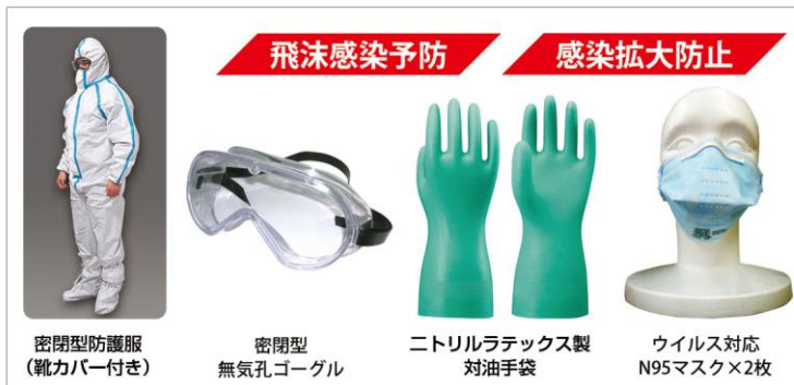
密閉型防護服 (靴カバー付き)