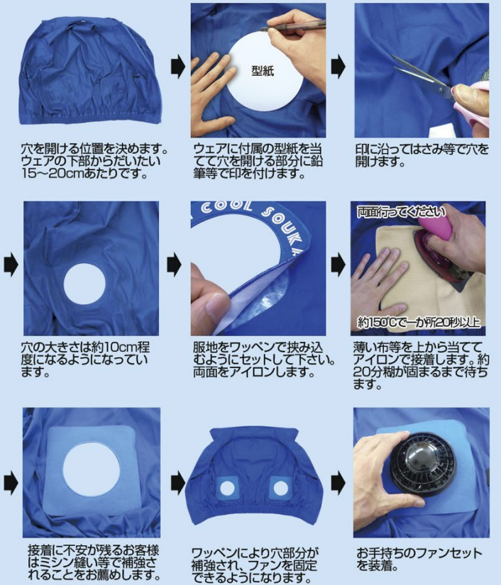
穴を開ける位置を決めます。ウェアの下部からだいたい15～20cmあたりです。