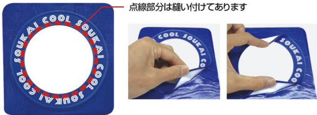
点線部分は縫い付けてあります