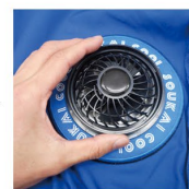
お手持ちのファンセットを装着。バッテリーも収納可。

【作業手順】 ※穴開け後ワッペン接着、ワッペン接着後穴開け、どちらでも取り付けことは可能です。