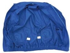
お手持ちのウェアに取付けられます。