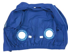
ワッペンにより穴部分が補強され、ファンを固定できるようになります。