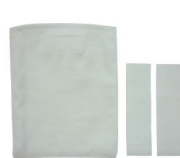
ポケット×1個 ループ×2本