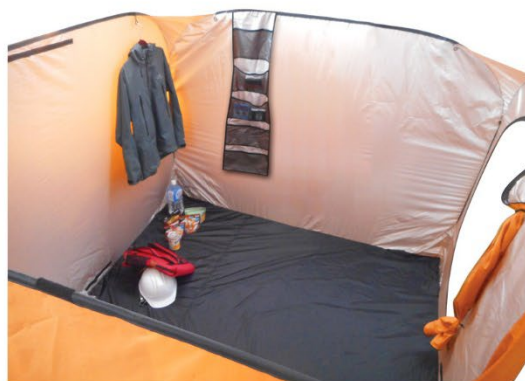
家族用の避難テントとしても使えます。