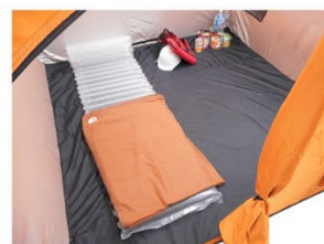
約210×210cmの広さなので簡易ベッドなども置いて快適です。