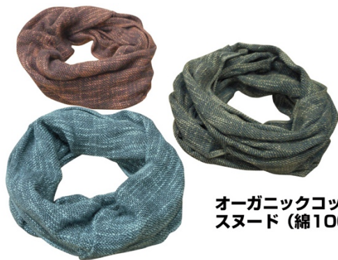
オーガニックコットン スヌード (綿100%)