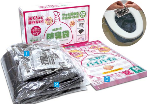
1 アルミ凝固消臭剤×30袋 2 汚物袋×30袋 3 おいバイバイ袋®×30袋